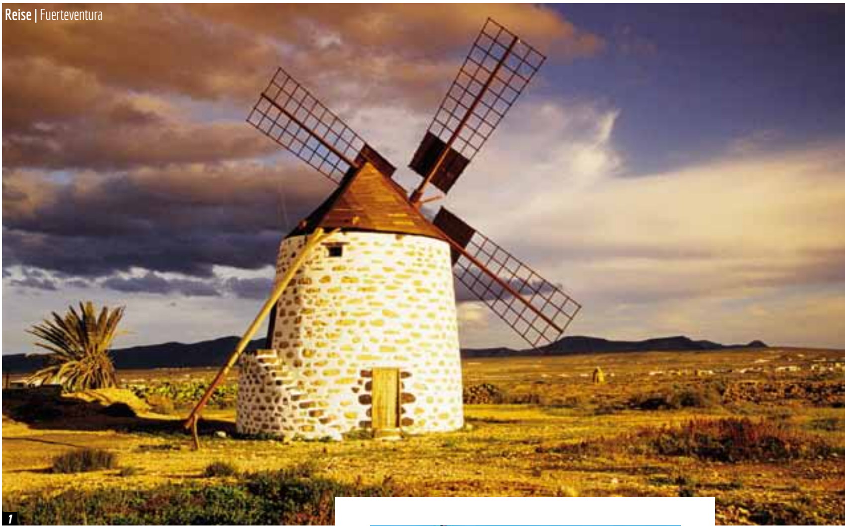
1 | Fantastische Farben: Mühle vor atemberaubender Landschaft 2 | Ayose und Guize überragen den Mirador Morro Velosa 3 | Farbenpracht auch unter Wasser: Kanarenhummer 4 | Jagdgemeinschaft: Eine Makrelenschule nutzt die Schildkröte als Deckung.

W enn der erste Eindruck zählt, und eigentlich tut er das immer, ist er schon das erste Plus für das Team von Deep Blue Diving. Auf der Tauchbasis angekommen, fühlt man gleich zweierlei: echte Gastfreundschaft und hohe Professionalität. Und das bestätigt sich über die gesamten Urlaubstage. Untergebracht auf dem Areal des Hotel Barceló Club El Castillo und zentral direkt am Hafen gelegen, vermittelt Deep Blue Diving ein ausgesprochen angenehmes Ambiente aus Tauchaktivitäten, aber auch jede Menge entspanntes Miteinander. Es werden taucherische Wünsche und Vorstellungen besprochen und aufeinander abgestimmt, eventuell noch fehlende Ausrüstungsteile ausgesucht und angepasst sowie die gewünschte Ausfahrtzeit verabredet. Sicherheit wird ebenso selbstverständlich großgeschrieben bei Deep Blue Diving. Dies unterstreicht die Beteiligung an einer modernen Druckkammer genau wie das hohe Sicherheitsniveau der üppig